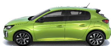
EQM0 - RUMENA AGUEDA