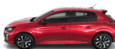
VHM5 - RDEČA ELIXIR