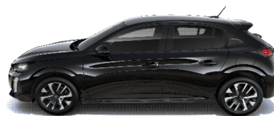
9VM0 - ČRNA PERLA NERA