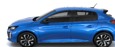
SMM6 - MODRA VERTIGO