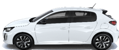
WPP0 - BELA BANQUISE